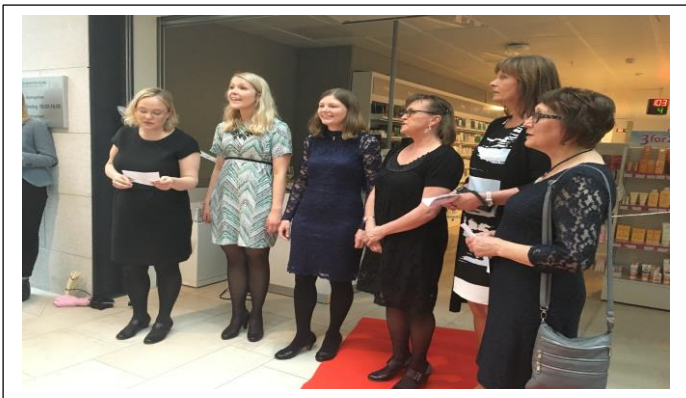
Lykkepillen, sto for det kulturelle innslaget ved åpningen!

En annen forlokkende sammenligning med Bodø er deres strategi for byen som reisemål. Da jeg leste tittelen på denne masterplanen synes jeg den passet like godt på oss, og på Sykehusapoteket i Bodø, nemlig; Vekst, verdiskapning og opplevelser i verdensklasse.