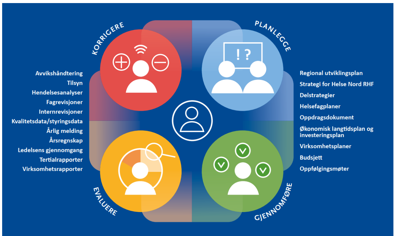
Figur 1- Helse Nord RHF's helhetlige styringsprosess. Vi planlegger og styrer helhetlig og langsiktig i tråd med forskrift om ledelse og kvalitetsforbedring i helse- og omsorgstjenesten.

Helse Nord RHF planlegger og styrer helhetlig og langsiktig. Vi skal være tydelige og forutsigbare i drift og utvikling av spesialisthelsetjenesten. Vår styringsprosess følger forskrift om ledelse og kvalitetsforbedring i helse- og omsorgstjenesten, hvor vi plikter å planlegge, gjennomføre, evaluere og korrigere . Dette sikrer helhet og sammenheng, slik figur 1 illustrerer.