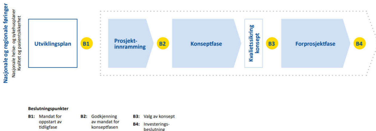
Figur 1 Faser og beslutningspunkter i tidligfasen for sykehusbyggprosjekter. Tidligfasen er markert innenfor stiplede linje, og beslutningspunktene er markert som gule sirkler.

Konseptfasen vil klargjøre premissene for innholdet i sykehuset i form av et hovedprogram, for deretter å identifisere, utvikle og utrede alternative muligheter (konsepter) for hvordan premissene kan løses i form av fysiske løsninger. Eventuelle nybygg, tomtevalg og et detaljert innhold i sykehus og DMS vil avklares i konseptfasen. Svært detaljerte spørsmål besvares ikke i denne saken.