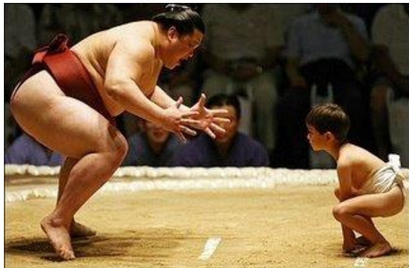
Verdens vanskeligste lederjobb